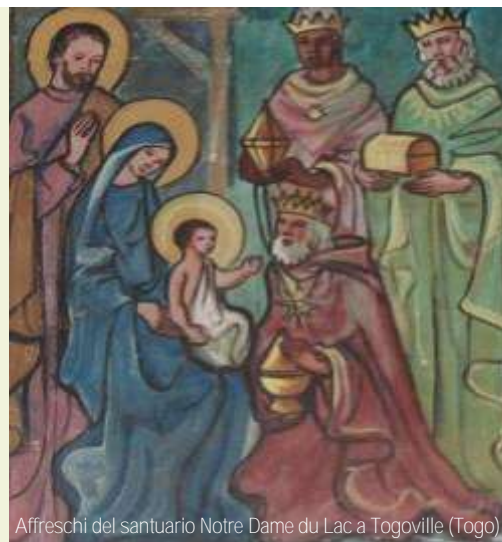
Affreschi del santuario Notre Dame du Lac a Togoville (Togo)